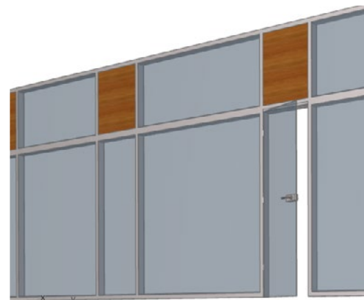
Detail programu ArchiCAD

Tyto produkty VERTI se v systému zobrazují ve 3D podobě jako reálný model, ve 2D jako výkresy a ve výkazech jako jednotlivé položky s technickými údaji, které je popisují. Práce s knihovnou BIM je v současnosti podporována programy ArchiCAD a Revit Architecture. Kompletní knihovna BIM je zdarma ke stažení na našich internetových stránkách www.verti.cz .